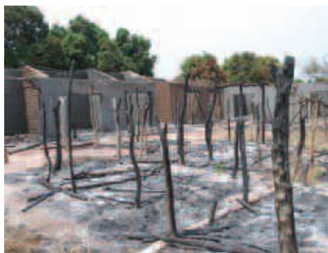
Tržiště ve vesnici Kouyougou, kterou vypálily jednotky prezidentské gardy

Ze slabosti armády těžší skupiny banditů, tzv. zaraguinas, pocházejících často ze sousedních zemí (Čad, Kamerun, Súdán). Tyto malé skupiny ozbrojených mužů, které se ukrývají v buši, vykořisťují vesničany a zvláště se zaměřují na bohatší skupiny obyvatel (pasterci), unášejí členy jejich rodin a požadují výkupné. Když se jim vesničané pokusí postavit na odpor, vraždí a vypalují vesnice (naposledy 11. října tohoto roku, vesnice západně od Bossangoa).