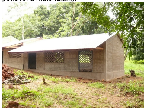
Jedna z budov nového stacionáře pro sirotky

Stavba stacionáře pro sirotky Arc-en-ciel (Duha) v Bozoumu je téměř dokončena. Je to komplex pěti domů (třída, velká jídelna, kuchyně, ošetrovna, kancelář, malý sklad potravin a materiálu...).