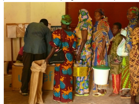
Rozdělení pomoci Světového potravinového programu uprchlíkům ve městě Bozoum

Situace v širokém okolí města Bozoum je pro místní obyvatele velmi těžká: skupiny ozbrojených banditů drancují vesnice a unášejí členy bohatších rodin na výkupné. Vesničané se před bandity uchylují s trochou zachráněného majetku do města, které je relativně bezpečné. Ve městě Bozoum je nyní asi 12 000 uprchlíků na 22 000 původních obyvatel. Karmelitánská misie, s níž SIRIRI spolupracuje, se snaží uprchlíkům vypomáhat, zajišťuje výuku jejich dětí, distribuci jídla od Světového potravinového programu a pomáhá