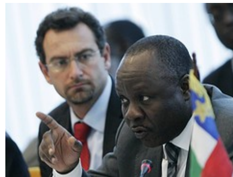
Zástupce SAR u kulatého stolu v Bruselu

Dárcovské státy a organizace přislíbily 600 miliónů dolarů pomoci na příští tři roky (to by