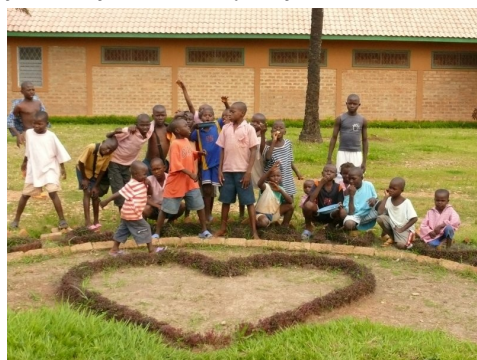
Děti ulice v současném středisku Voix du Coeur

Se středoafričskou organizací Voix du Coeur jsme projednali detaily projektu Studna pro