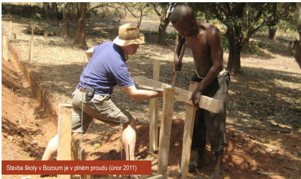
Stavba školy v Bozoum je v plném proudu (únor 2011)