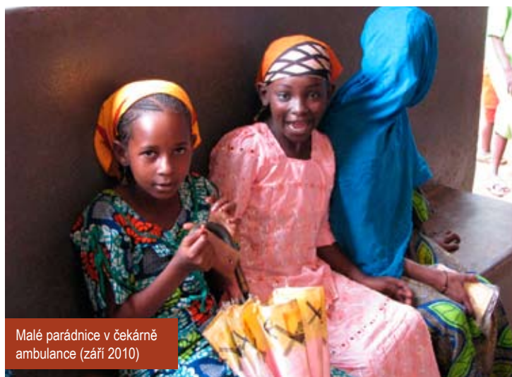
Malé parádnice v čekárně ambulance (září 2010)