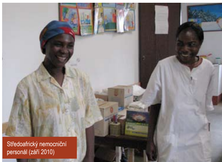
Středoafričtý nemocniční personál (září 2010)