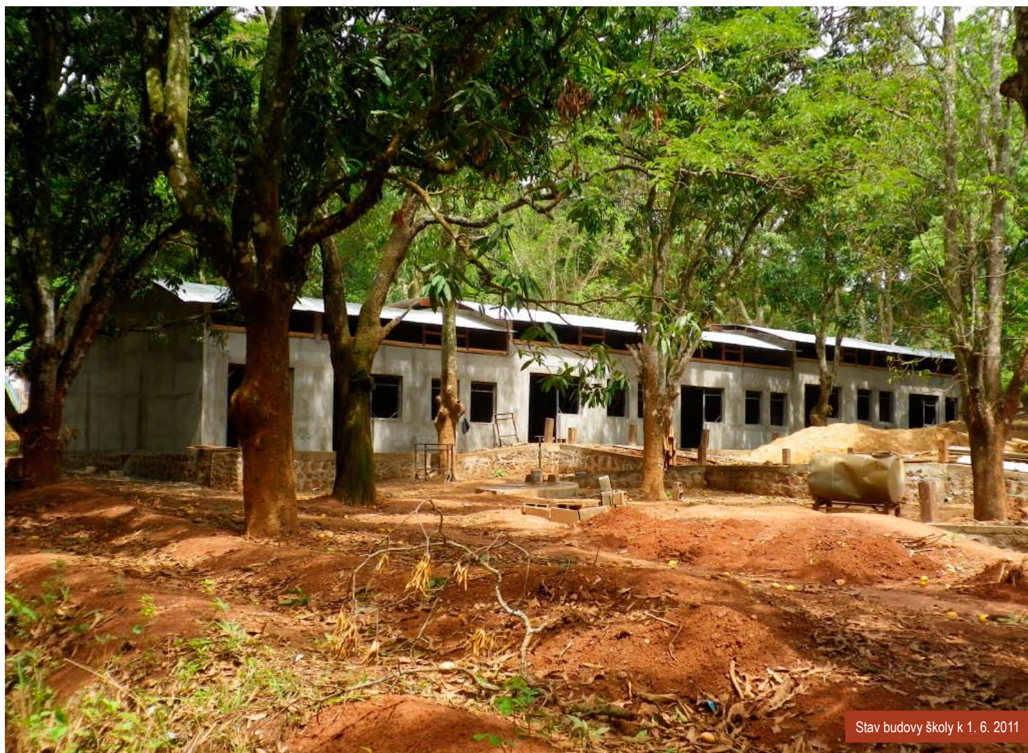
Stav budovy školy k 1. 6. 2011

Přispívat můžete jakoukoli částkou na účet 636682/5500 .