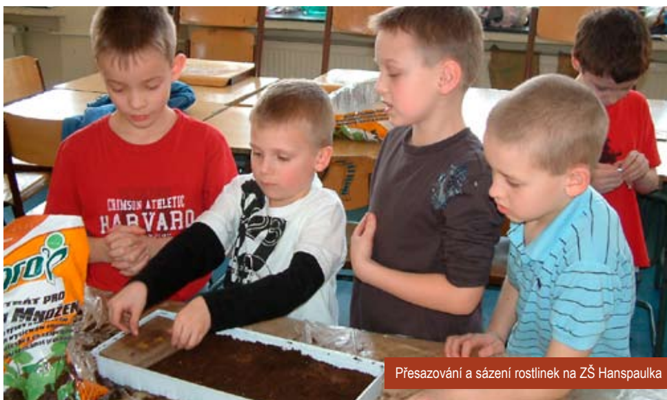
Přesazování a sázení rostlinek na ZŠ Hanspaulka